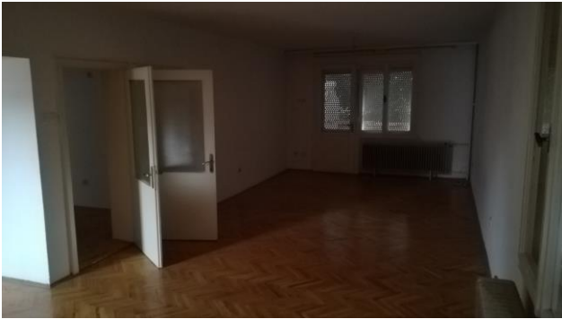
Салон – 1 кат