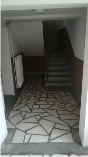
Влез - приземје