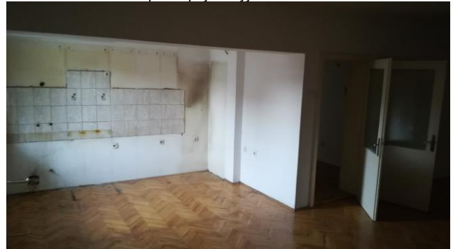
Трпезарија и кујна – 1 кат