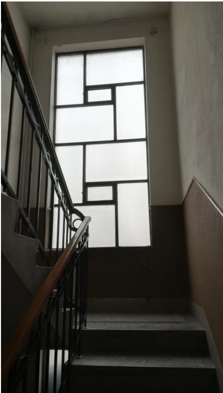
Скали - 2 кат