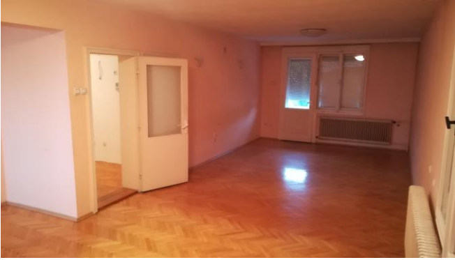
Салон – 2 кат